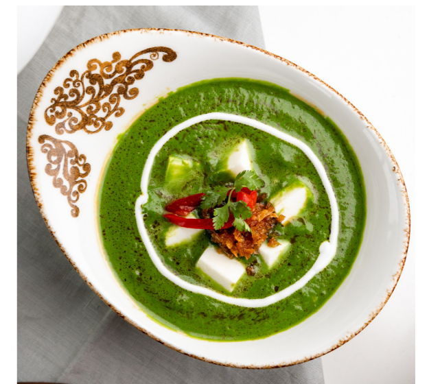
*جميع الأسعار تشمل ضريبة القيمة المضافة

8.500 د.ب لحم ضأن بالكاربي محضر على الطريقة المتزلية التقليدية، مطهو بإناء الضفط لمذاق طري وغني.